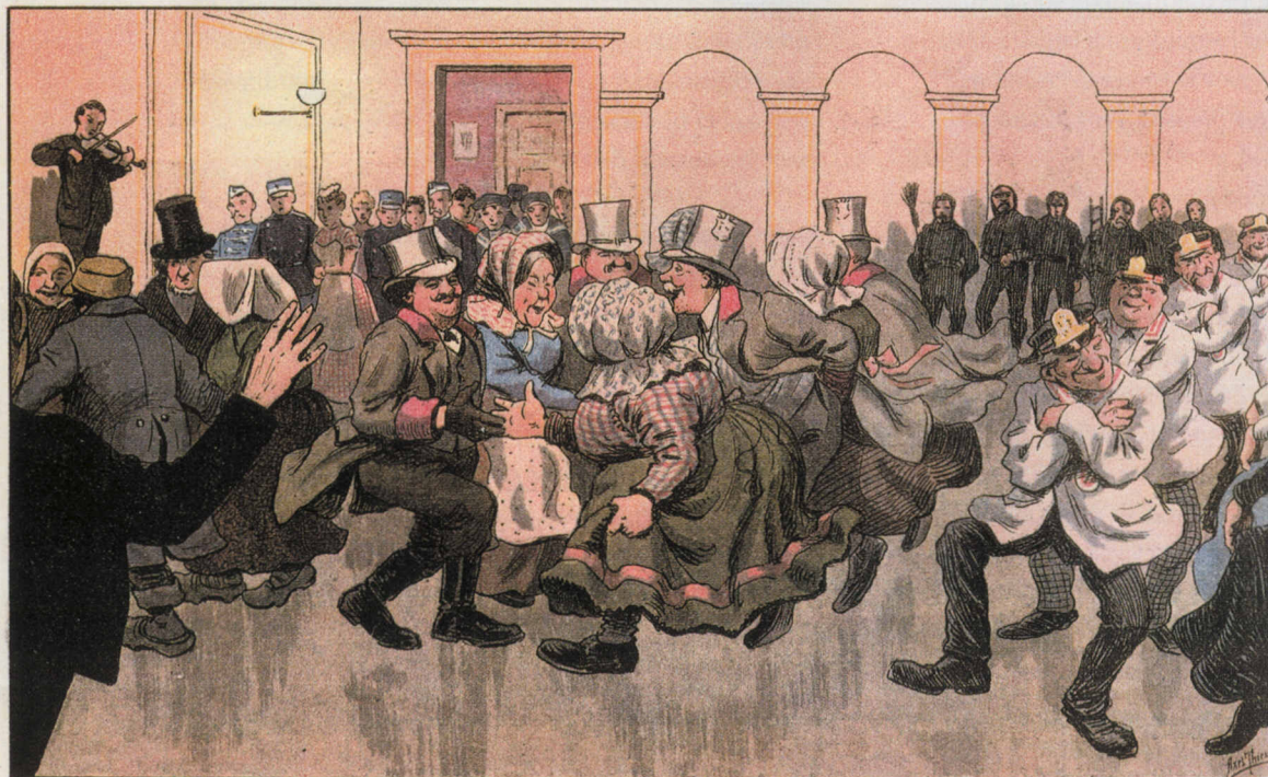
Indøvelse af Folkedansene gaar som en Bølge over Landet.

Landsforeningen Danske Folkedansere ønsker FFF tillykke med de 100 år.